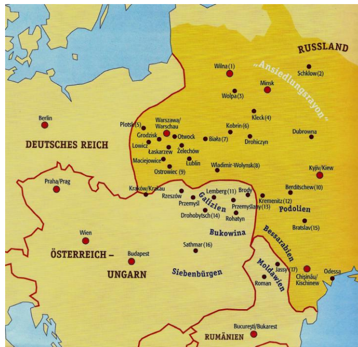
Die Städte mit großem jüdischen Bevölkerungsanteil

Zu dieser Zeit lebte knapp ein Viertel der russischen und litauischen Juden in erbärmlichen Verhältnissen: kinderreiche Familien zusammengedrückt in einer Hütte oder einem Kellergeschoss... Während der endlosen Folge von Ausschreitungen und Elend zogen bis 1914 weitere anderthalb Millionen Juden fort aus der alten Heimat, Frauen, Kinder, ältere Familienangehörige, ja ganze Dorfgemeinschaften... Durch den Verlust eines Drittels des osteuropäischen Judentums verwaisten ganze Landstriche, und die verbliebene Bevölkerung verelendete (nach Ottens/Rubin 1999, S. 179-180).