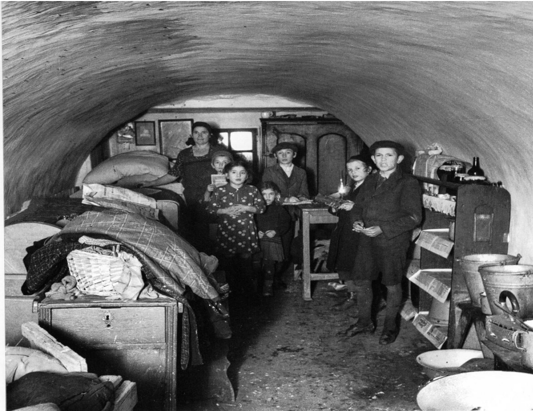
Kellerwohnung in Warschau circa 1936

überlebten, verdankten sie häufig nur der ausgeprägten individuellen und kollektiven jüdischen Wohltätigkeit (Haumann 1998, S. 102-103).